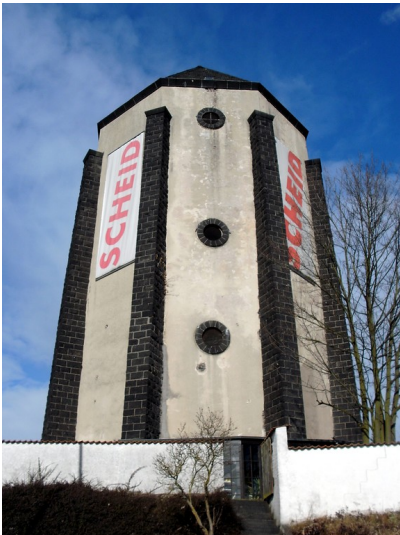
Der größere der beiden Wassertürme in der Nähe des Mayener Bahnhofs Ost (2013).