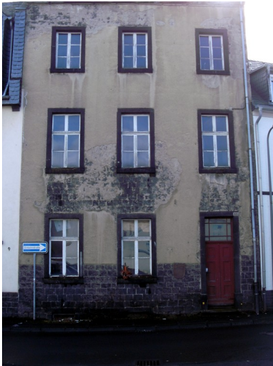
Das Gebäude der jüdischen Schule "im Entenpfuhl" in Mayen (2013).