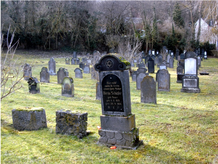
Blick auf das Gräberfeld auf dem jüdischen Friedhof Waldstraße in Mayen (2013).