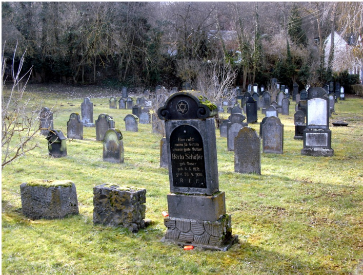
Blick auf das Gräberfeld auf dem jüdischen Friedhof Waldstraße in Mayen (2013).