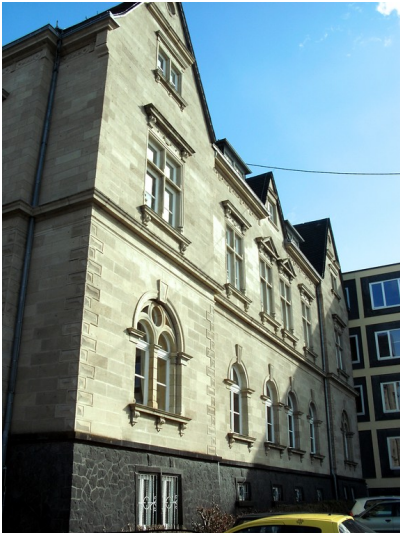
Das Gebäude des ehemaligen Landratsamts Mayen, heute Fachhochschule für öffentliche Verwaltung Rheinland-Pfalz (2013).