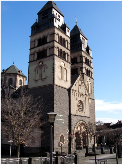
Die westliche Fassade der katholischen Pfarrkirche Herz-Jesu in Mayen (2013).