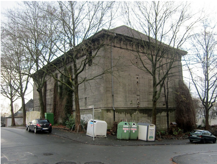
Der Luftschutz-Hochbunker in der Münzstraße in Wuppertal-Barmen (2014).