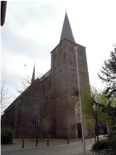
St. Maria Magdalena in Sonsbeck mit dem Hauptportal und dem nördlichen Seitenschiff (2008)