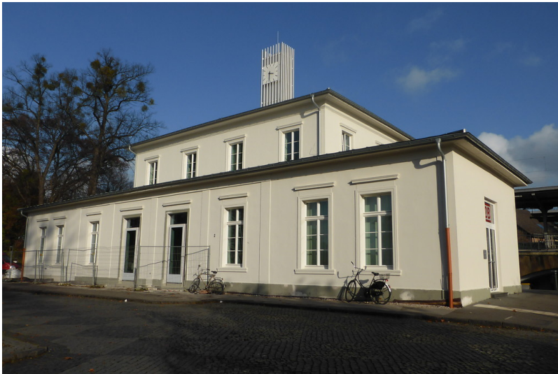
Empfangsgebäude des Brühler Personenbahnhofs (2014)