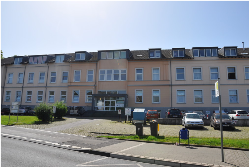
Ehemaliges Verwaltungsgebäude des Eschweiler Bergwerksvereins in Eschweiler-Pumpe (2014)