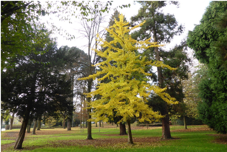
Der Kierberger Bahnhofspark in Brühl mit altem Baumbestand (2014)