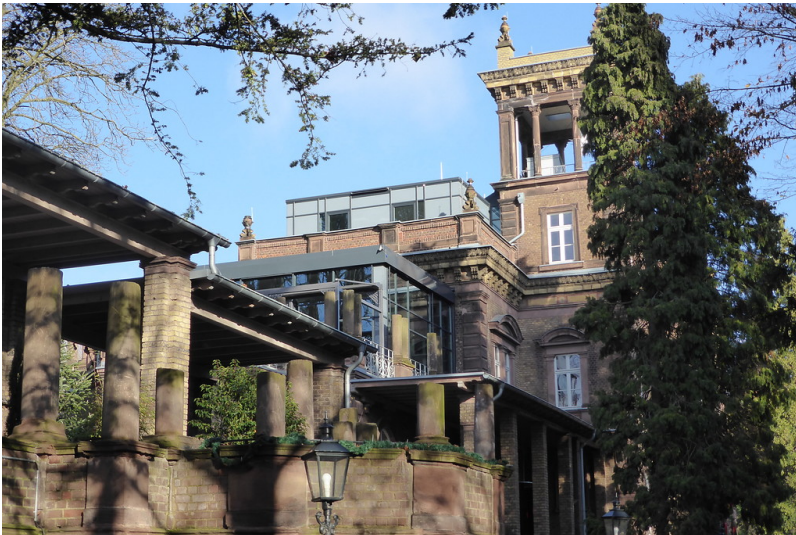
Empfangsgebäude am Bahnhof Kierberg in Brühl mit Terrassenanlagen