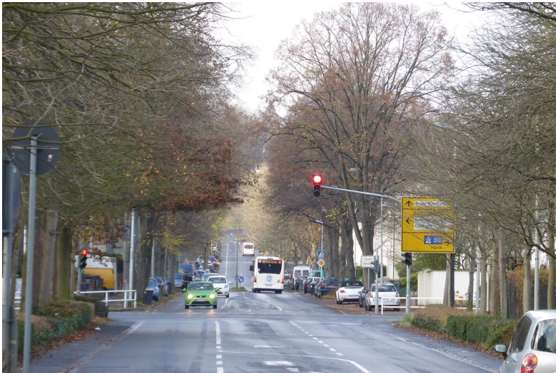
Blick auf die Kaiserstraße in Brühl in Richtung Bahnhof Kierberg