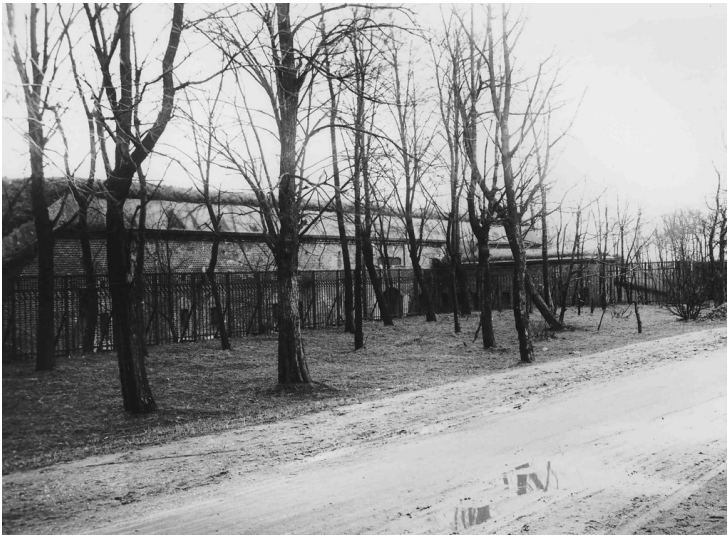
Zwischenwerk vor der Schleifung um 1920