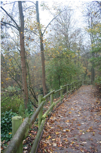
Felsengarten an Fort VI (2014)