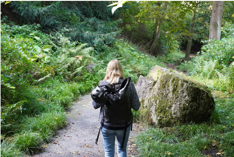
Blick auf einen Weg im Felsengarten in Köln (2021).