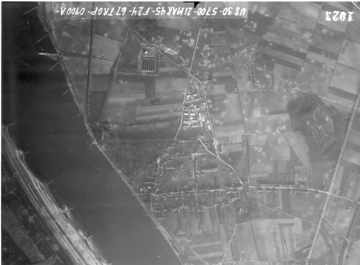
Luftaufnahme von Fort XII