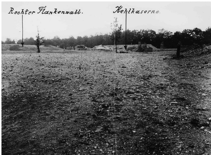
Fort X nach der Schleifung um 1920