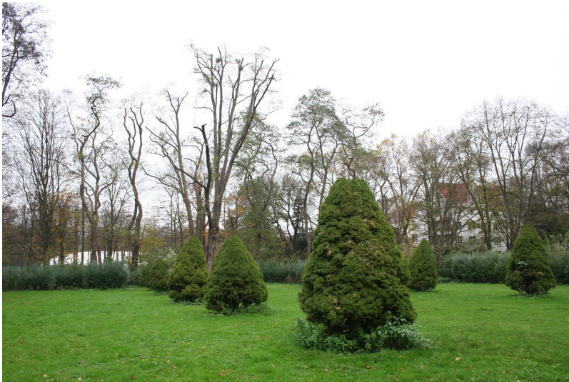
Beethovenpark in Köln-Sülz (2014).