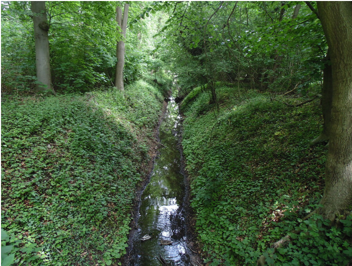
Der Duffesbach in Köln-Sülz (2021).