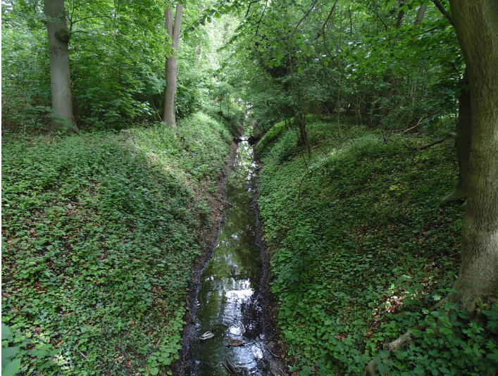
Der Duffesbach in Köln-Sülz (2021).