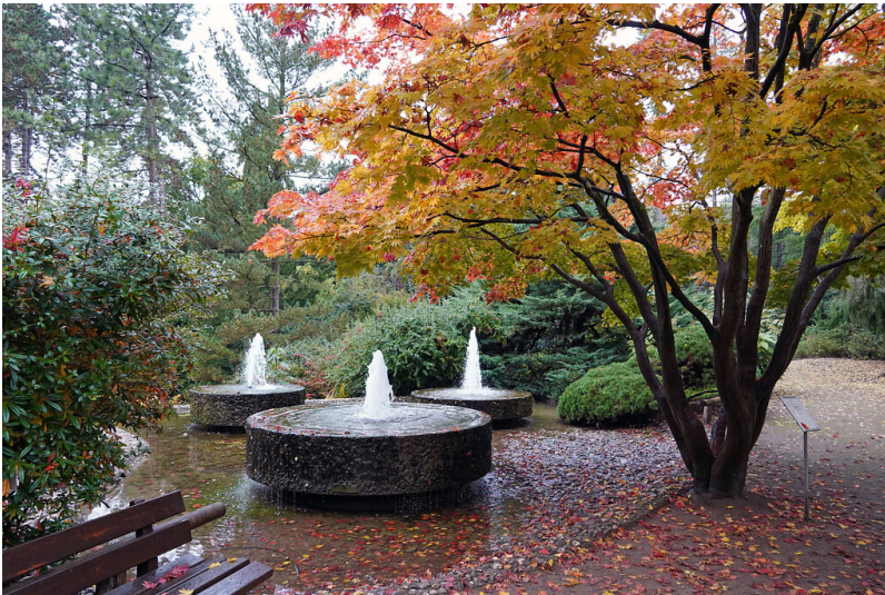
Brunneninstallation im Forstbotanischen Garten in Köln-Rodenkirchen (2021).