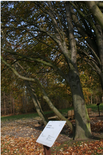
Informationstafel der Bäume im Arboretum am Stadtwald (2014)