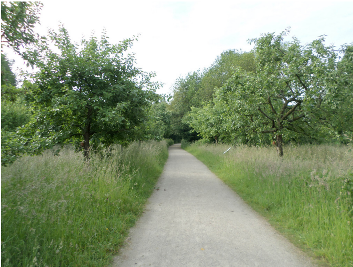
Finkens Garten (2014)