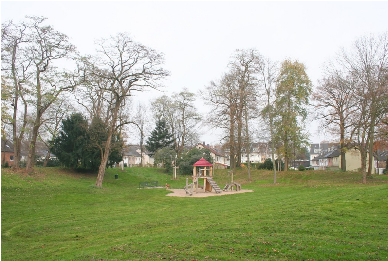
Bruder-Klaus-Siedlung in Köln-Mülheim, das Gelände des ehemaligen Forts (2014).