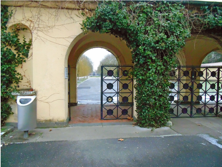
Blick durch das linke Tor des Haupteingangsportals auf den Westfriedhof in Köln-Vogelsang (2021).