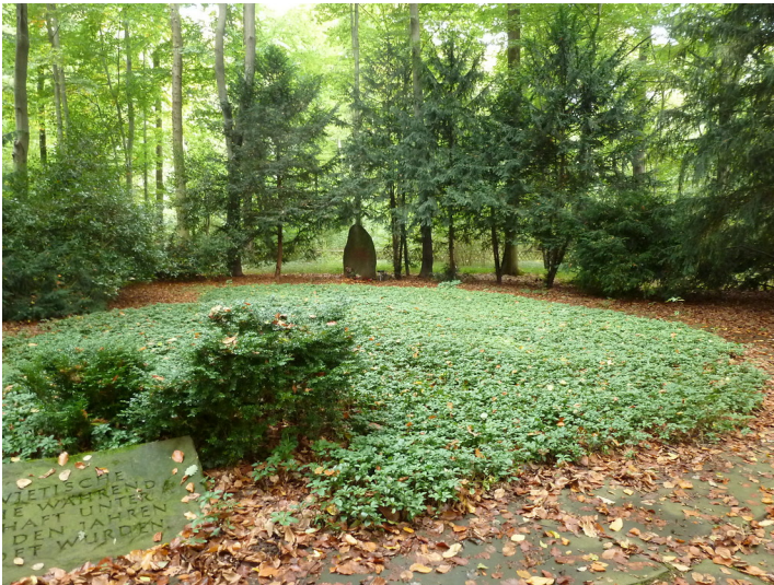
Gedenkstätte für Opfer der NS-Herrschaft im Gremberger Wäldchen (2014): Blick auf das Areal der Gedenkstätte mit Bodendeckern im Zentrum und Nadelgehölzen am Rand.