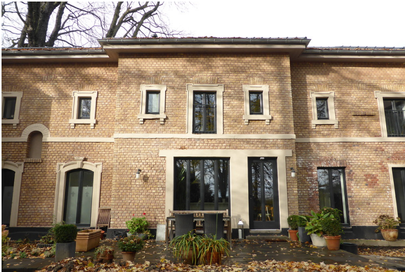
Trafohaus am Bahnhof Kierberg in Brühl von der dem Gleis abgewandten Seite aus gesehen