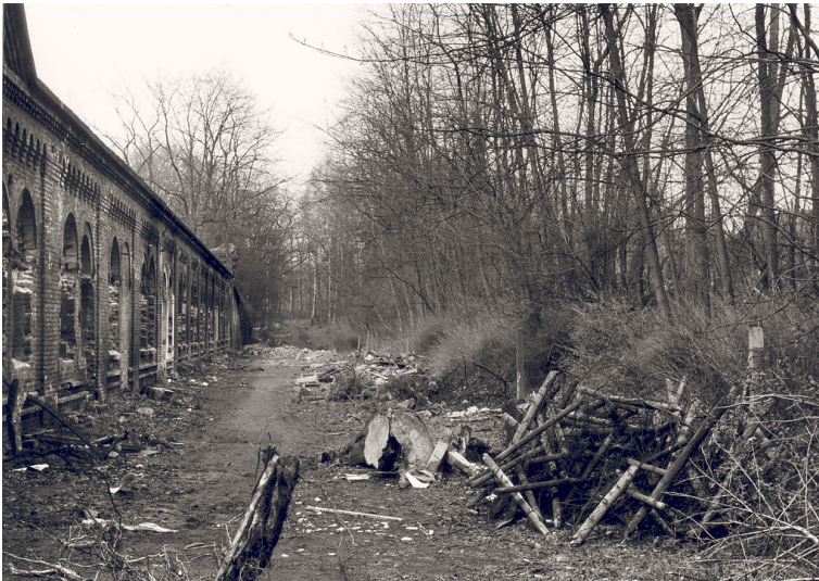
Der rechte Seitenflügel der vormaligen Fort V des äußeren Kölner Festungsringes in Müngersdorf (1962), der Graben wurde zugeschüttet.