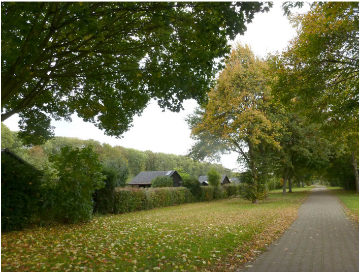
Kleingartenanlage in der Westhövener Aue (2014)