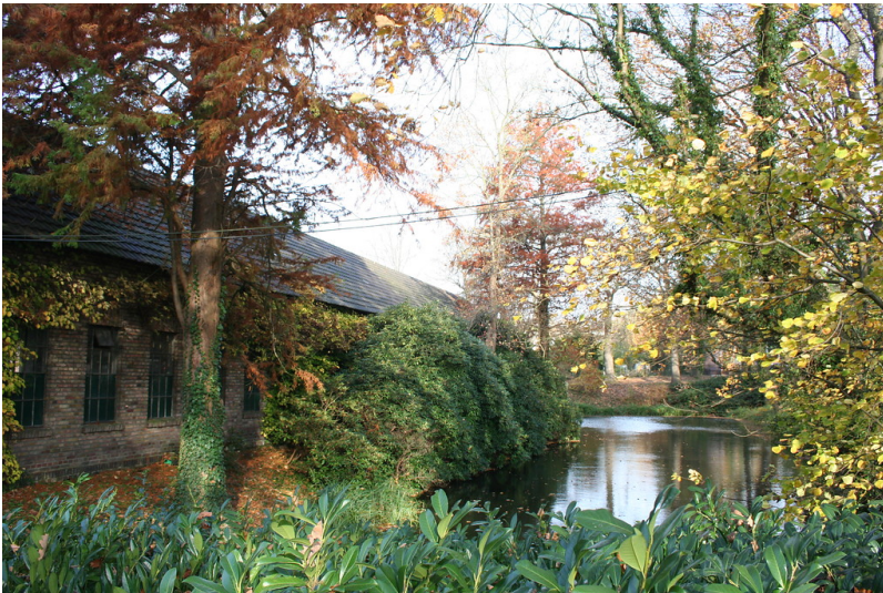
Historischer Wassergraben am Stüttgenhof in Köln-Junkersdorf (2014)