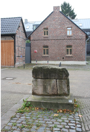
römisches Brandgrab (2014)