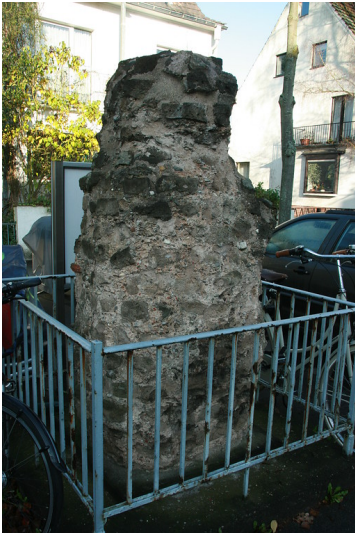
Pfeilerstumpf der römischen Wasserleitung an der Berrenrather Straße in Köln-Sülz (2014).