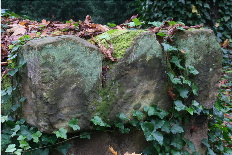
Römischer Sarkophag auf dem Südfriedhof (2014)