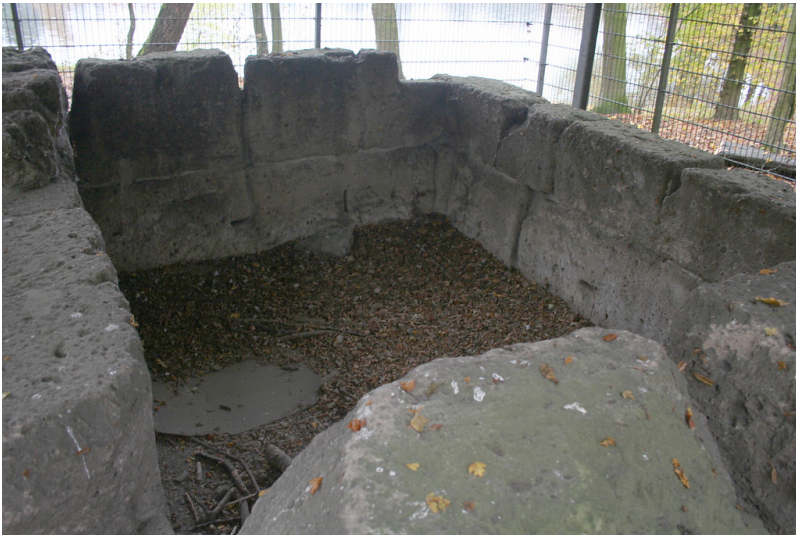
Römische Grabkammer am Kalscheurer Weiher (2014)