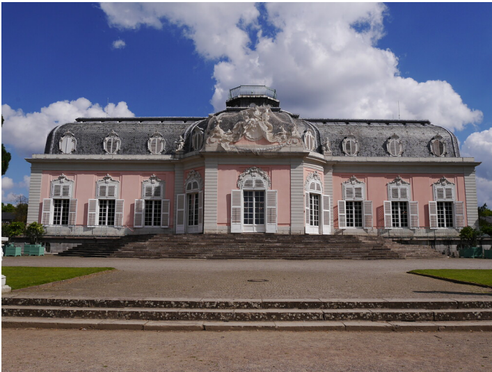
Schloss Benrath (2020)