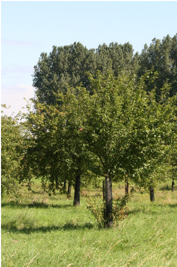
Streuobstwiese Flittard Nord (2014)