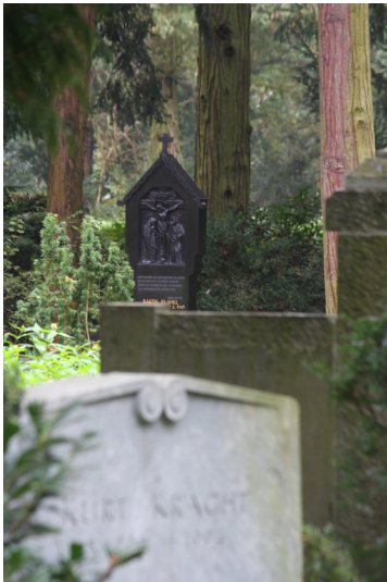
Grabsteine auf dem Südfriedhof (2014)