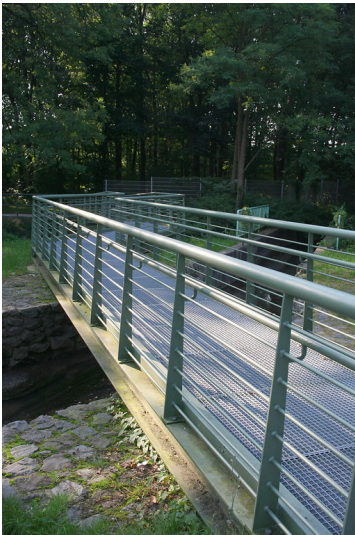
Aussichtsplattform mit Blick auf die Kreuzung (2014)