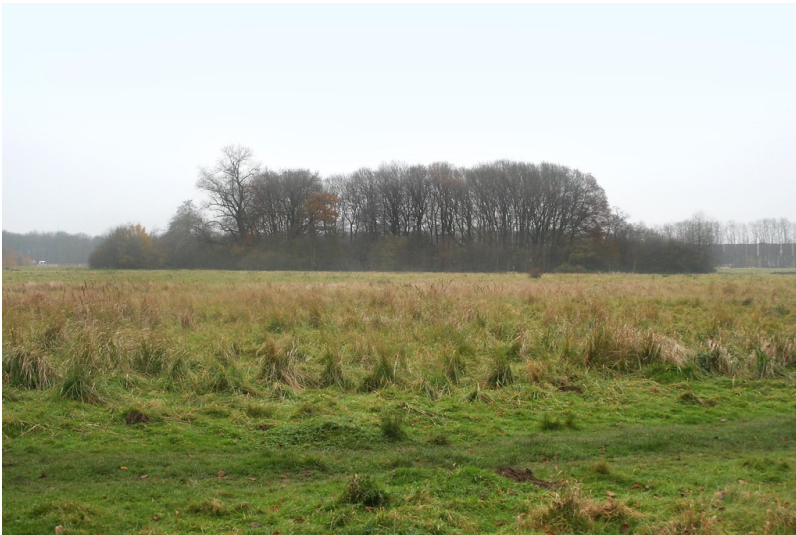
Blick auf das Vogelwäldchen im Nüssenberger Busch aus der Entfernung (2014)