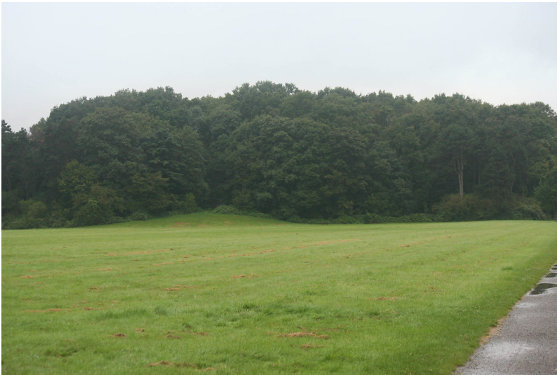
Der Haselberg (2014)