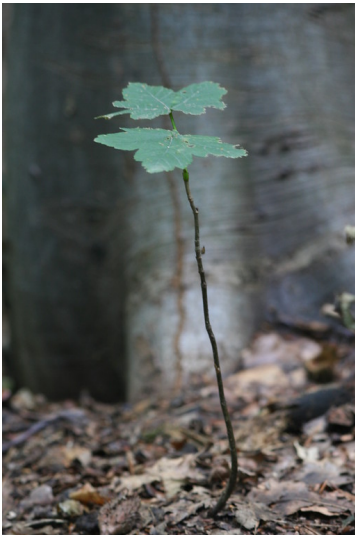
Hutewald Schönrath (2014)