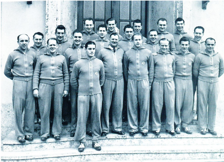
Aufnahme aus den 1950er Jahren mit einer Auswahl der deutschen Fußball-Nationalmannschaft mit ihrem Trainer Josef "Sepp" Herberger und Spielführer Fritz Walter (3. und 4. von links).