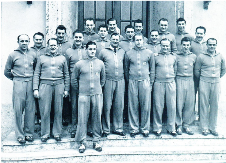
Aufnahme aus den 1950er Jahren mit einer Auswahl der deutschen Fußball-Nationalmannschaft mit ihrem Trainer Josef "Sepp" Herberger und Spielführer Fritz Walter (3. und 4. von links).