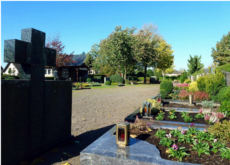
Blick auf den Friedhof von Andernach-Kell (2014)