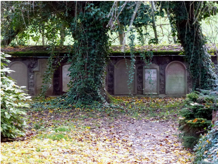
Blick auf den Mennonitenfriedhof in Andernach-Kell (2014).