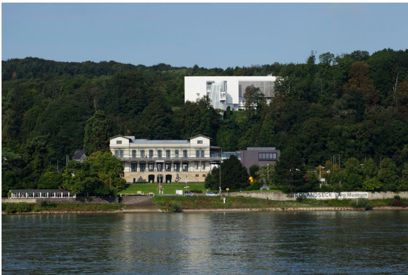
Das Empfangsgebäude des Bahnhofs Rolandseck von der rechten Rheinseite aus gesehen (2014)