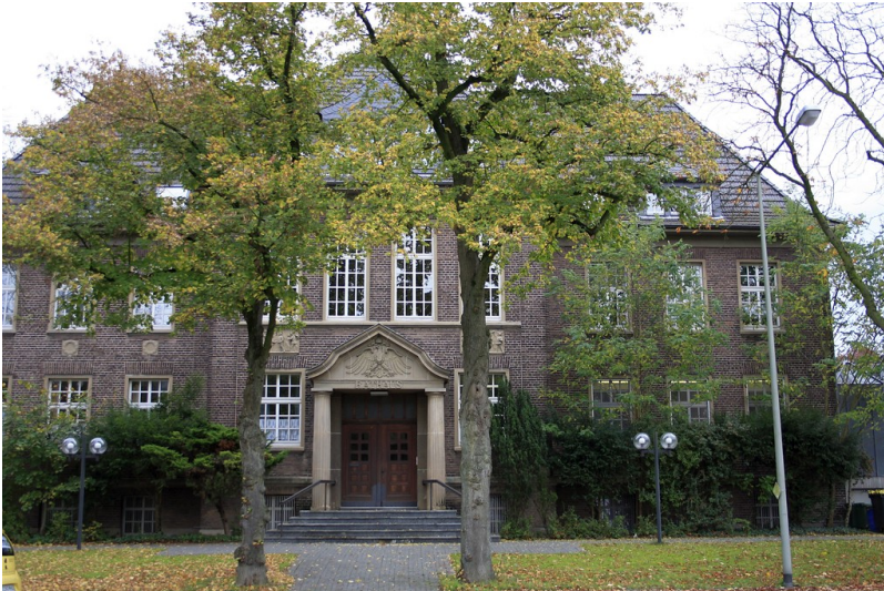
Das ehemalige Rathaus an der Frankfurter Straße in Voerde. Heute wird es als Seniorenheim genutzt (2014).