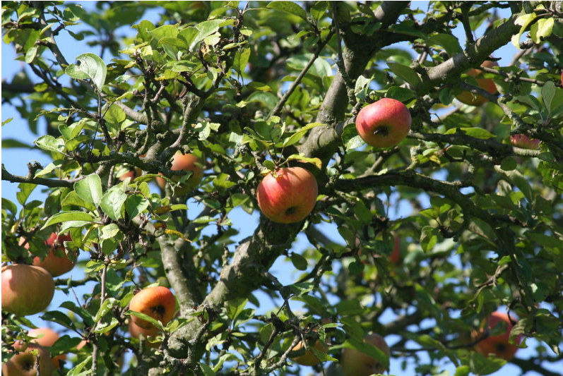
Streuobstwiese Flittard Süd im Spätsommer (2014)