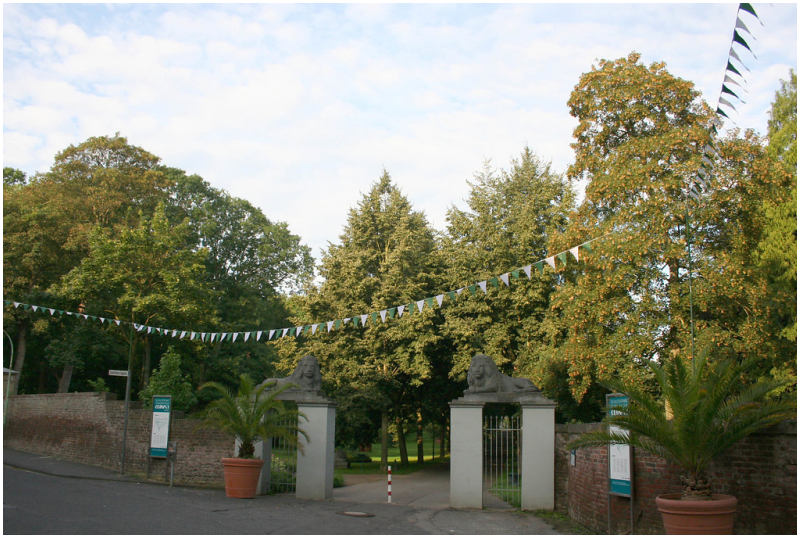
Eingang zum Schlosspark Stammheim (2014)