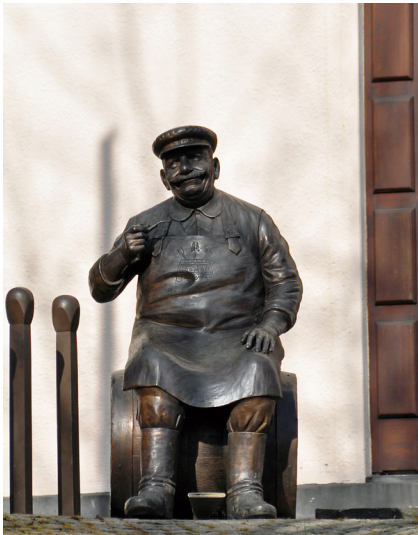
Heimatmuseum vor dem Türmchen Am Werth in Hitdorf (2015)