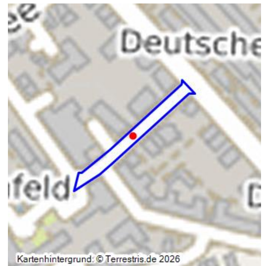
Ausschnitt aus der Deutschen Grundkarte 1:5.000, Blatt 5208.29, Kessenich, aus dem Jahr 2001. Im zentralen Bereich des Kartenbildes sind die Wohnhäuser Heinrich-Brüning-Straße 7/9, 11, 13 markiert, die 2004 abgerissen wurden.

Die Heinrich Brüning Straße (ehemals Petersbergstraße) ist - zusammen mit der Kurt Schumacher Straße (ehemals Drachenfelsstraße) - eine Neutrassierung aus der Zeit um 1906 auf den Freiflächen zwischen Bonn und Bad Godesberg, in Rheinnähe.